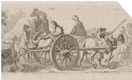
← Ausschnitt aus: Die Einwanderung der Franzosen, Kupferstich von Daniel Chodowiecki, Berlin 1771, Germanisches Nationalmuseum, Nürnberg.