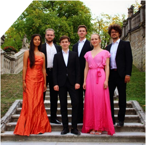
↑ Alte Musik trifft auf Neue Musik – zu erleben beim Auftritt von canto chiaro.