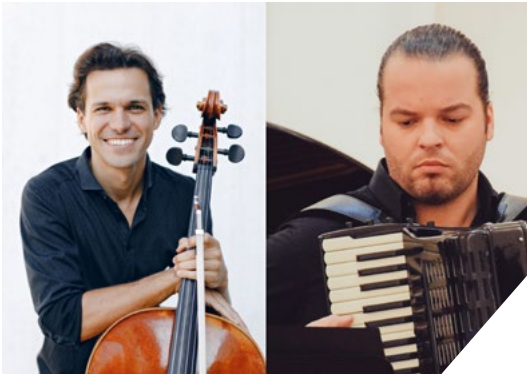
↑ Mit Cello, Akkordeon und Bandoneon eröffnen Menage de Musique neue Klanghorizonte.